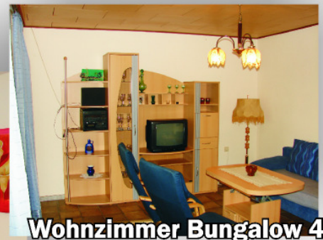
Wohnzimmer Bungalow 4