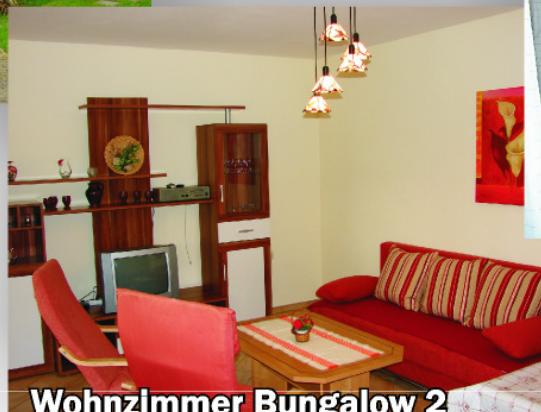
Wohnzimmer Bungalow 2